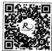
QR CODE สำหรับจองห้องพัก มหาวิทยาลัยศิลปากร

โทรศัพท์: ๐๒-๔๒๒-๙๒๒๒ โทรสาร : ๐๒-๔๓๓-๕๘๘๐ E-mail : rsvn@royalriverhotel.com