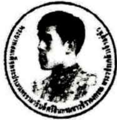
ด้านหน้า