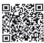
รายละเอียดโปสเตอร์