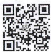
สมัครลงทะเบียน

งานศูนย์ฝึกอบรมและพัฒนาบุคลากร โทร ๐ ๕๔๒๒ ๑๖๑๔, ๐ ๕๔๒๑ ๗๔๕๖ ต่อ ๑๐๐ โทรสาร ๐ ๕๔๒๒ ๕๐๒๐ E-mail : academic.service@mail.bcnlp.ac.th