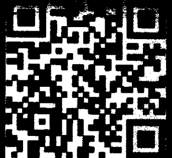
ผ่าน QR CODE

f https://www.facebook.com/kprumspr_mibextid_ZbWKwL