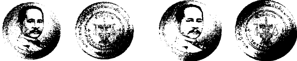
ชนิดเหรียญทองแดง ประเภทธรรมดา ขนาดเส้นผ่านศูนย์กลาง 30 มิลลิเมตร