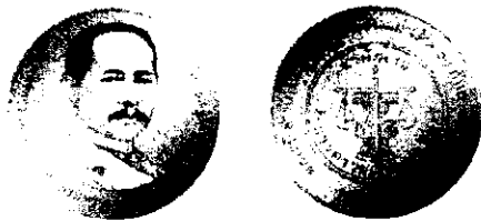
ชนิดเหรียญเงิน ประเภทธรรมดา ขนาดเส้นผ่านศูนย์กลาง 30 มิลลิเมตร

สำนักงานการตรวจเงินแผ่นดินจัดทำเหรียญที่ระลึก เนื่องในโอกาสครบรอบ ๑๐๘ ปี แห่งการสถาปนาสำนักงานการตรวจเงินแผ่นดิน เพื่อน้อมรำลึกในพระมหากรุณาธิคุณพระบาทสมเด็จพระจุลจอมเกล้าเจ้าอยู่หัว พระบิดาแห่งการตรวจเงินแผ่นดินไทย