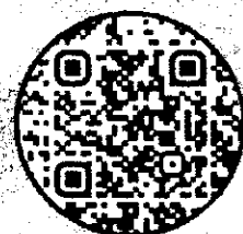
QR Code ในจอง