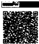
ร่วมทำบุญผ่านระบบ E - Donation