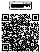
ร่วมทำบุญเข้าบัญชี