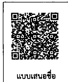
แบบเสนอชื่อ