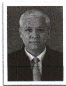
๔.พล.ต.ท.ปัญญา เอ่งฉ้วน อดีต ผบช.กมค.