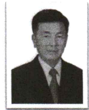
๓.พล.ต.อ.ชัยยง กীরติขจร อดีต รอง ผบ.ตร.