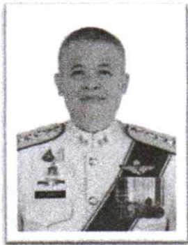
๑.พล.ต.ท.กมล เจริญรักษา อดีตผู้ทรงคุณวุฒิพิเศษ ตร.