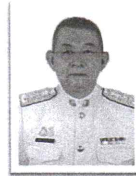
๑๔.พลตำรวจโท เสถียร คูวิบูลย์ศิลป์ อดีตผู้ทรงคุณวุฒิพิเศษ ตร.