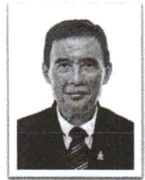
๖. พลตำรวจโท อำนาจ นิยมะโน อดีต ผบช.ภ.๑