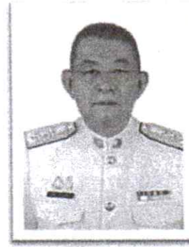
๑๔.พล.ต.ท.เสถียร คุวิบูลย์ศิลป์ อดีตผู้ทรงคุณวุฒิพิเศษ ตร.