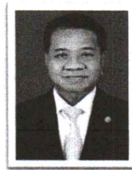
๙.พลตำรวจเอก วิเชียร พงษ์โพธิ์ศรี อดีต ผบ.ตร. , อดีตเลขาธิการ สมช. อดีตปลัดกระทรวงคมนาคม