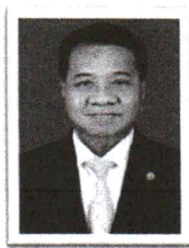
๙.พล.ต.อ.วิเชียร พงษ์โพธิ์ศรี อดีต ผบ.ตร. , อดีตเลขาธิการ สมช. อดีตปลัดกระทรวงคมนาคม