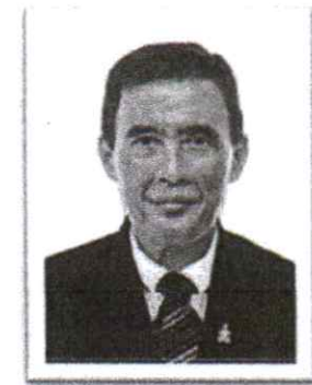
๖.พล.ต.ท.อำนาจ นิยมะโน อดีต ผบช.ภ.๑