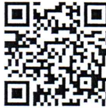
สมัครอบรม