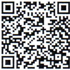
รายละเอียดหลักสูตร