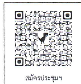
สมัครประชุมฯ