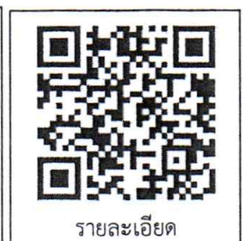
รายละเอียด