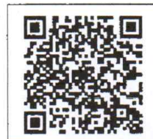
QR-Code เพื่อสอบถาม