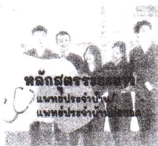
หลักสูตรระยะยาว