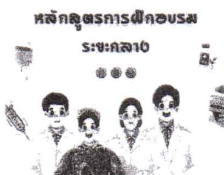
หลักสูตรระยะกลาง