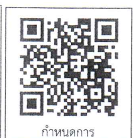
กำหนดการ