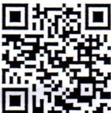
QR Code ลงทะเบียน