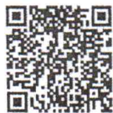
ช่องทางการส่ง หลักฐานการร่วมทำบุญ

ร่วมทำบุญโดยเช็คธนาคาร..... สั่งจ่ายในนาม ชื่อบัญชี “สำนักบริหารกลาง (เงินทำบุญ)” บัญชีออมทรัพย์ ธนาคารกรุงไทย จำกัด (มหาชน) สาขาศูนย์ราชการฯ แจ้งวัฒนะ (อาคาร บี) บัญชีเลขที่ ๙๘๐-๒-๑๖๔๒๔-๐ เลขที่เช็ค.....สาขา.....ลงวันที่.....จำนวนเงิน.....บาท