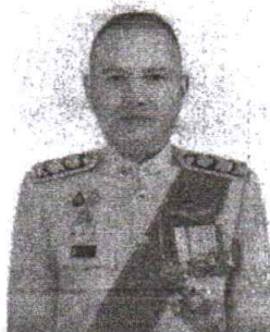
๑. พลตำรวจเอก รอย อิงคไพโรจน์ เลขาธิการสภาความมั่นคงแห่งชาติ

หากท่านใดมีข้อมูล ข้อเท็จจริง และข้อคิดเห็นเกี่ยวกับผู้สมัครเข้ารับการสรรหา เป็นบุคคลผู้สมควรได้รับการแต่งตั้งเป็นผู้ตรวจการแผ่นดิน